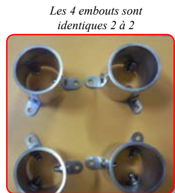
Les 4 embouts sont identiques 2 à 2

Afin de faire ressortir, visuellement vos embouts GUN, vous pouvez également peindre les fonds et cuvette de vos enjoliveurs de silencieux.