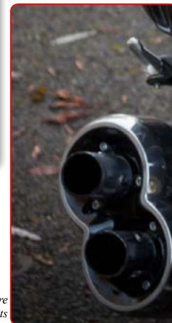
Peindre le fond des enjoliveurs pour faire ressortir vos embouts