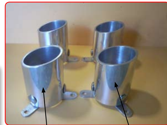
Haut droit ou bas gauche